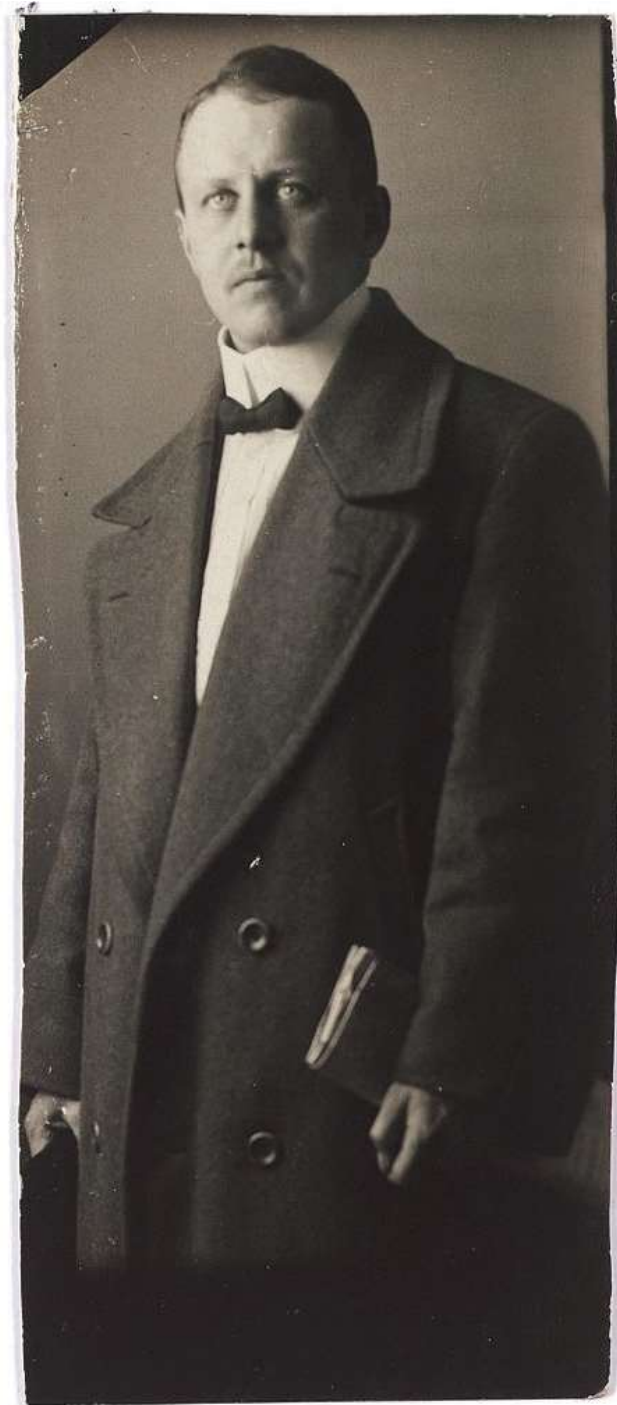
Deze foto is afkomstig van het regionaal archief Tilburg.