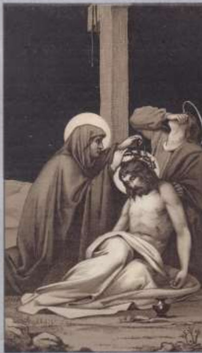
F. SNEYTS W. B. B. W. B. B.